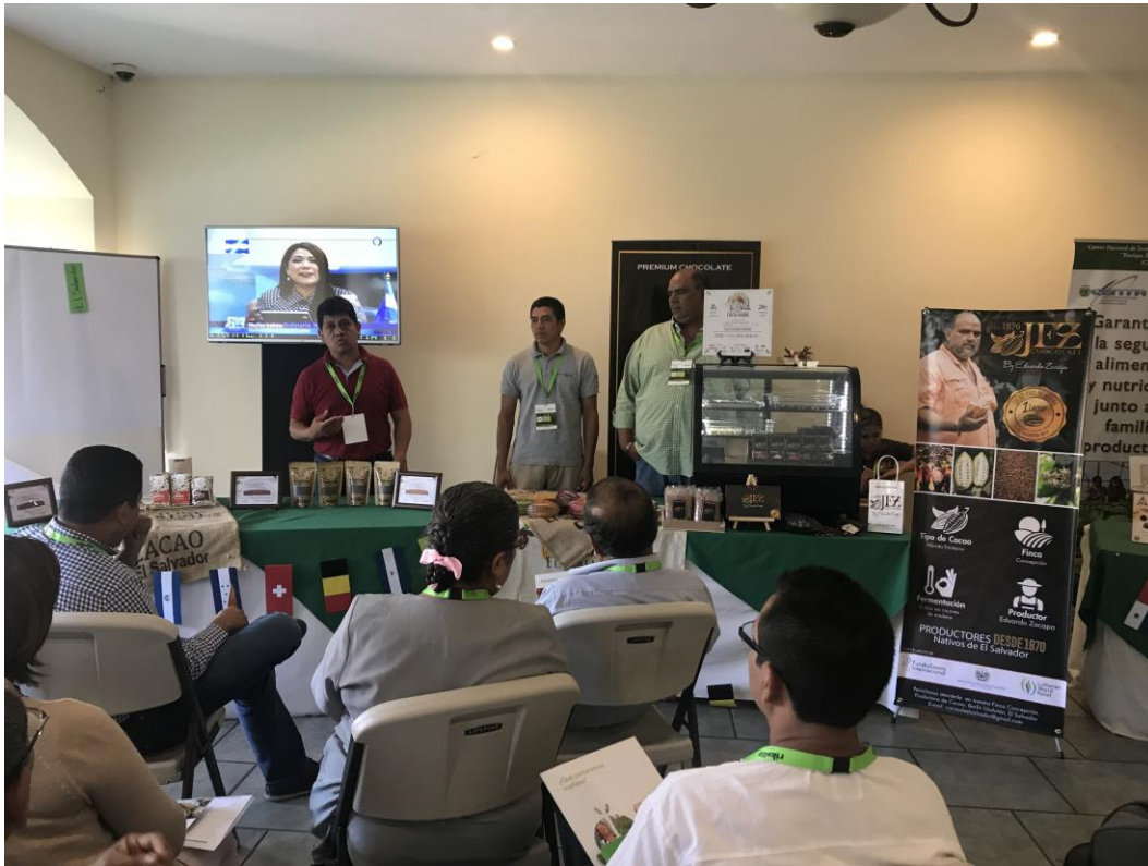
Participantes en visitas a los stands por país