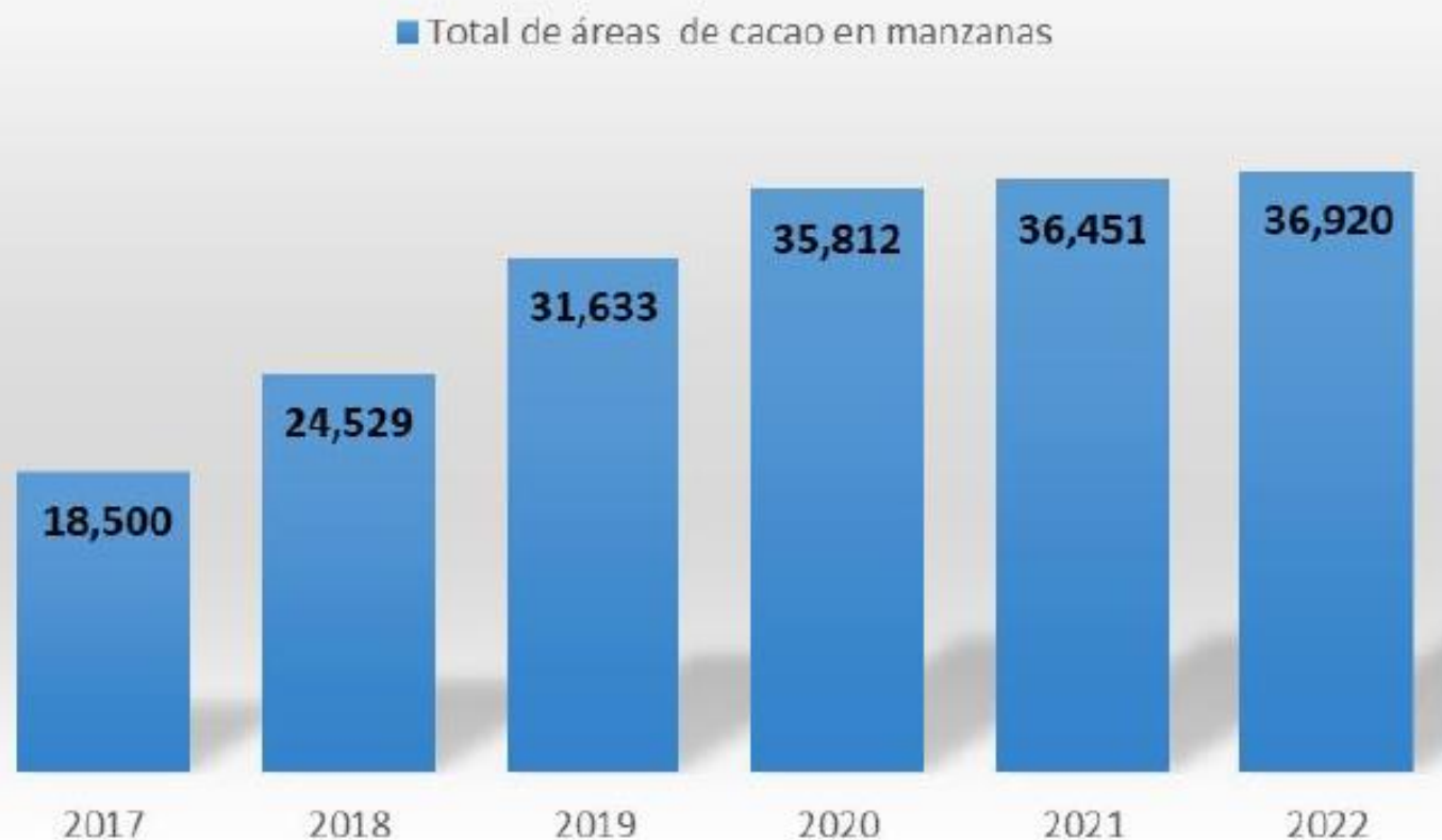
Gráfico 1. Proyección de crecimiento en áreas de cacao.

Esta es una conservadora proyección con la información actual.