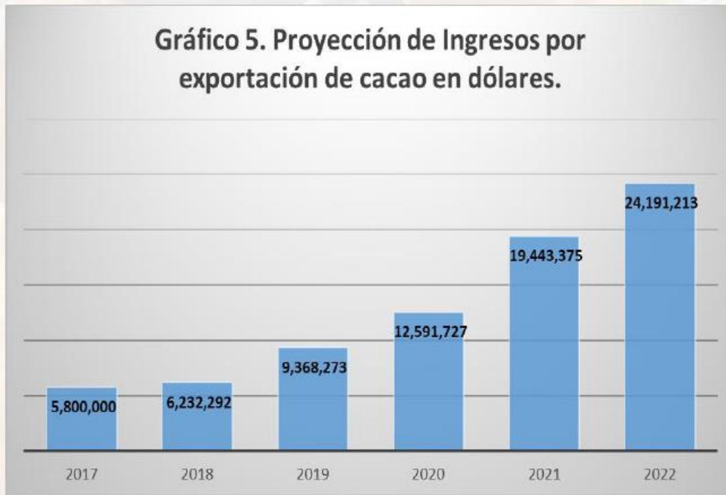
Gráfico 5. Proyección de Ingresos por exportación de cacao en dólares.

Existen precios de nichos de mercado arriba de 3500 US$/TM siendo proyecciones conservadoras.